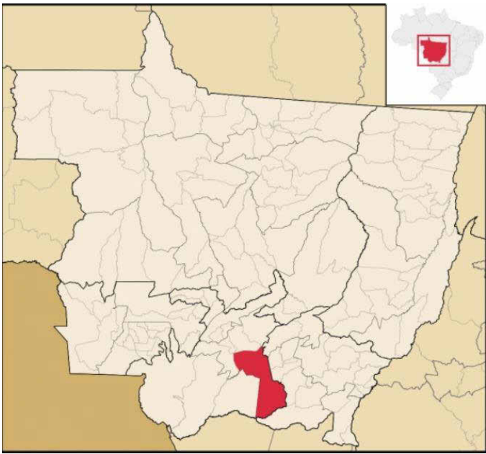
4 LOCALIZAÇÃO 1 : 100