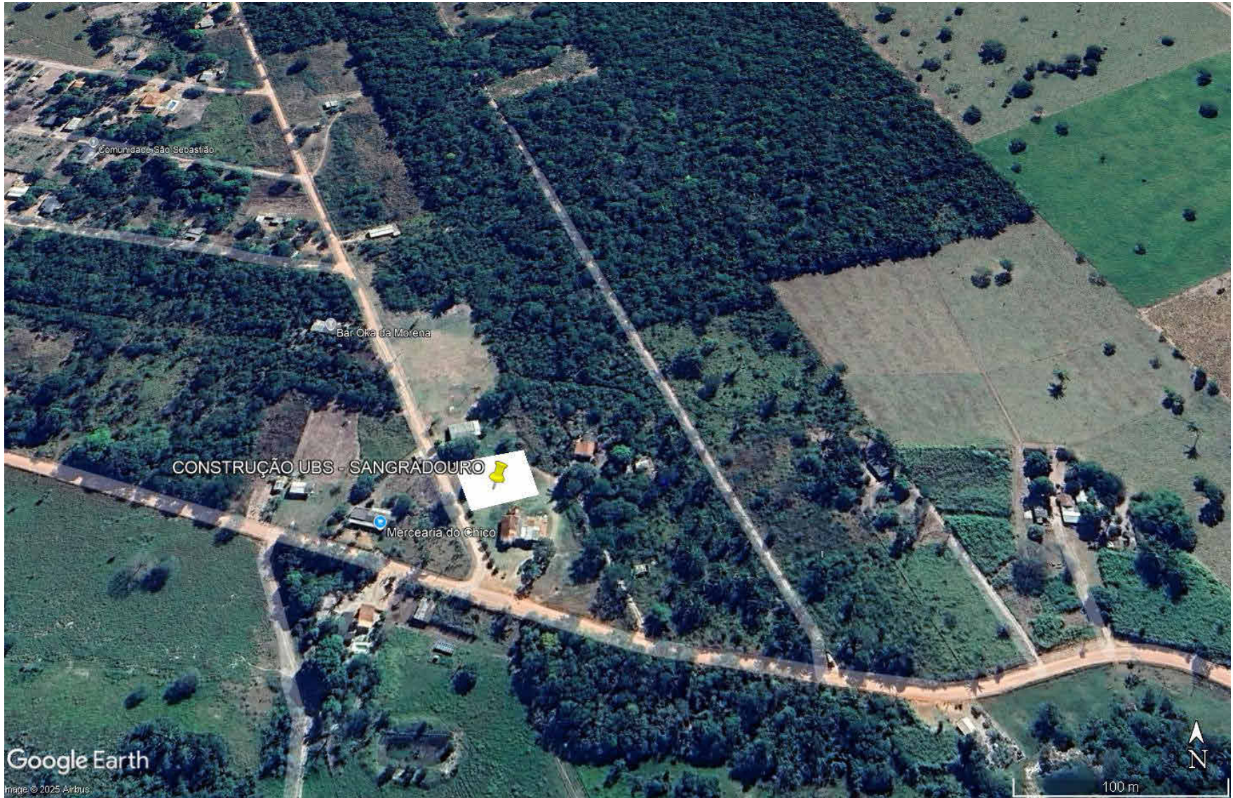
5 IMAGEM SATÉLITE 1 : 100