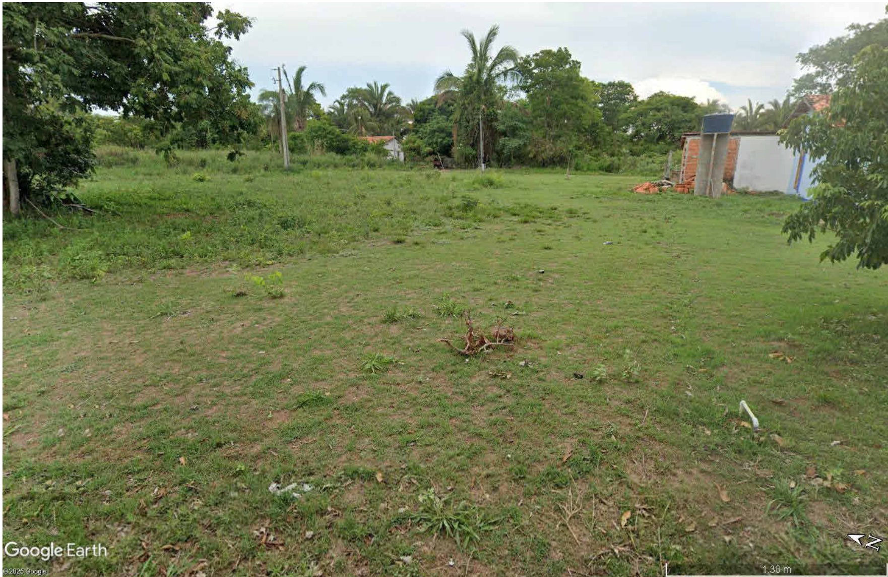
6 PERSPECTIVA DO TERRENO 1 : 100